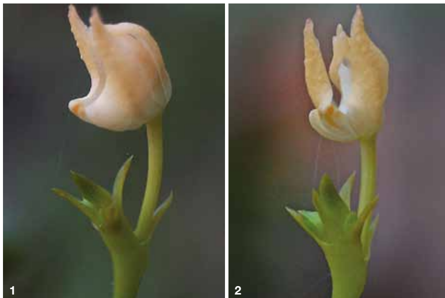
1. und 2. Thrixspermum nicolasiyorum ca. 7 × nat. Größe/nat. size

Key words: Orchidaceae, Aeridinae, Thrixspermum , Thrixspermum nicolasiyorum , Dendrocolla , Ilocos Norte, Luzon, Philippinen