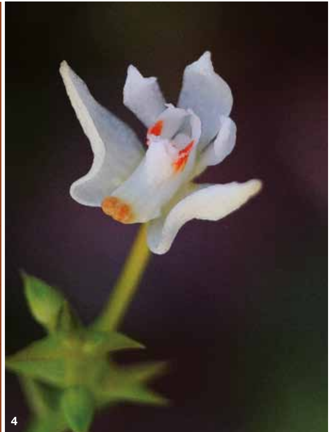
4. Thrixspermum nicolasiyorum CALARAMO, COOTES et NAIVE ca. 8 x nat Größe/nat. size