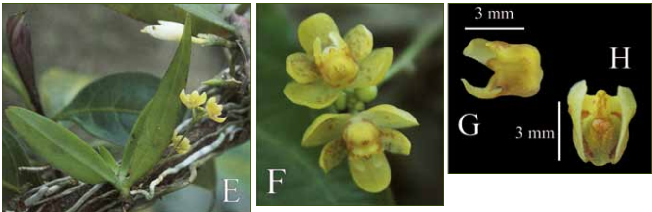
1. Thrixspermum ancoriferum (GUILLAUMIN) GARAY

Specimen examined: – Hon Ba (Khanh Hoa province) BV 141.