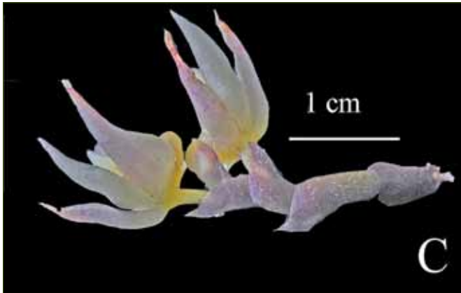
1. Thrixspermum fragrans RIDL.

C. Thrixspermum fragrans RIDL., Einzelblüten seitlich/Individual blossoms lateral