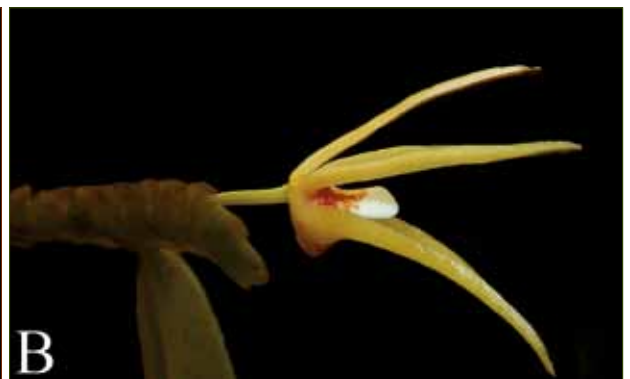
1. Thrixspermum LOUR.