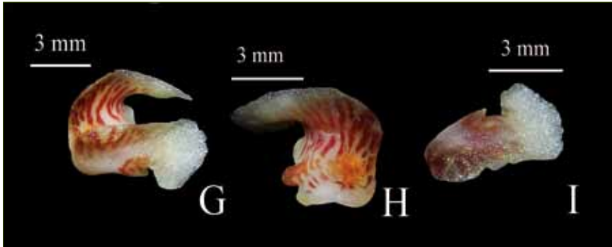
2. Thrixspermum pygmaeum (KING et PANTLING) HOLTUM D. Dorsales Sepalum/Dorsal sepal E. Laterale Sepalen/Lateral sepals F. Petalen/Petals G. Lippe in Seitenansicht/Lip side view H. Lippe, ein Seitenlappen entfernt/Lip one lateral lobe removed I. Seitenlappen der Lippe/Lateral lobe of lip J. Pollinien/Pollinia (D – J vergrößert/enlarged)