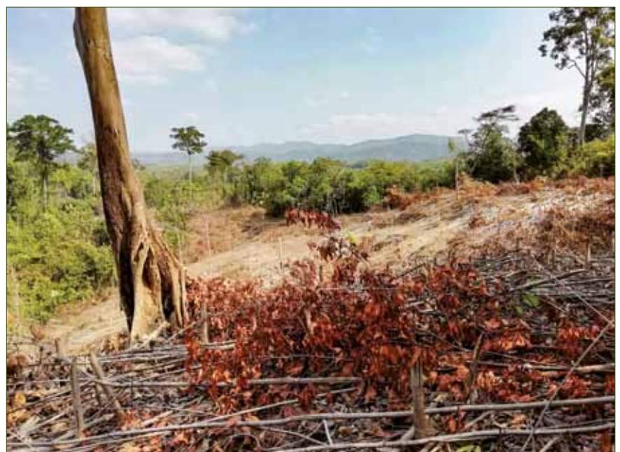
Zerstörung des natürlichen Waldes durch Feuer für die traditionelle Jhum-Kultur in einem immergrünen Regenwald im Sangu Reserve Forest in Bandarban

Pomatocalpa decipiens , Thrixspermum trichoglottis , Acampe praemorsa var. longepedunculata ) sind gefährdet (EN), 12 Arten ( Apostasia nuda , Brachycorythis helferi , Dendrobium anceps , Dendrobium fimbriatum , Dendrobium lindleyi , Micropera rostrata , Oberonia mucronata , Pelatantheria insectifera , Peristylus goodyeroides , Phalaenopsis deliciosa , Thrixspermum centipeda , Oberonia gammiei ) sind gefährdet (VU), drei Arten ( Aerides multiflora , Bul-