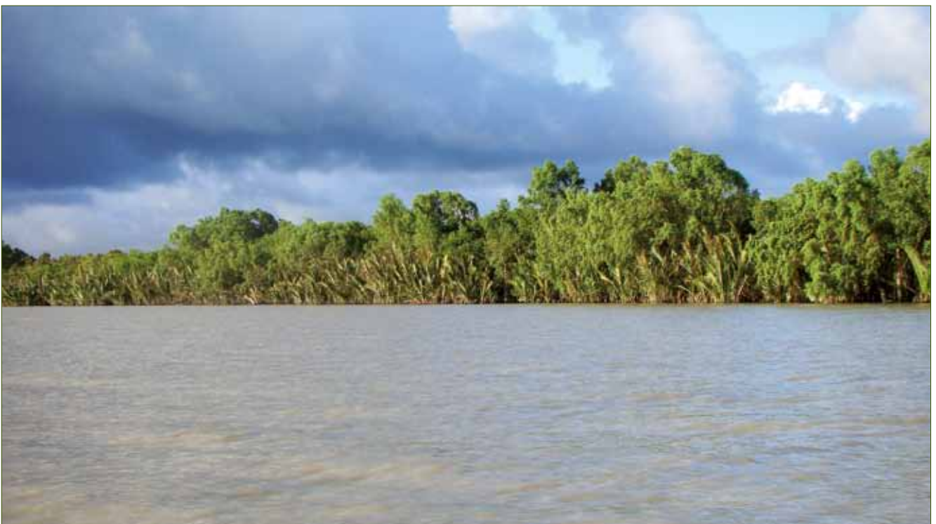
In den Sundarbans, dem größten Mangrovenwald der Welt, sind 19 Orchideenarten heimisch.

Von den Arten haben 84 einen medizinischen und 60 einen gärtnerischen