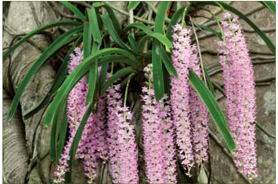
Rhynchosstylis retusa , bekannt als Fuchsschwanz-Orchidee, ist in ganz Bangladesch verbreitet.

Bislang wurden in Bangladesch keine spezifischen Schutz- und Forschungsprojekte für Orchideenarten betrieben. In den meisten Naturwäldern Bangladeschs wurden zahlreiche floristische Erhebungen durchgeführt. Die Ergebnisse zeigen jedoch Lücken in Bezug auf die Orchideenflora. Einige wildlebende Arten wurden in verschiedenen botanischen Gärten, die direkt vom Fachbereich Botanik verwaltet werden, an mehreren öffentlichen Universitäten in Bangladesch als Ex-situ-Erhaltung konserviert. Trotz der 53 Schutzgebiete im ganzen Land, die 3,1% der