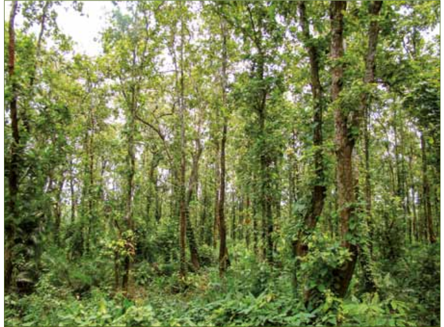
Feuchter laubabwerfender Salwald ( Shorea robusta ) in Modhupur, Tangail – hier kommen relativ wenige Orchideenarten vor.

Kürzlich wurden 1 000 Wildpflanzenarten bewertet, um den regionalen IUCN-