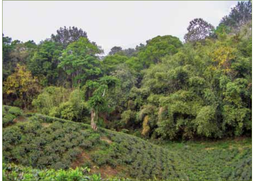
Teeplantage, Maulvibazar – nach Abholzung des immergrünen Regenwaldes

Abstract: A region of Bangladesh, known as Chittagong Hill Tracts (CHT), has been integrated into the Indo-Burma Biodiversity Hotspot, where various wild plants and animals thrive. The CHT comprises an extensive expanse of hills in the far southeast of Bangladesh, bordered by India and Myanmar. The mixed evergreen forest in greater Sylhet along the Assam Hills and CHT is rich with numerous wild plants. The climate is tropical, and it favours the proliferation of a large variety of orchid species. However, the forest areas (Bandarban, Rangamati, Khagrachari, Chittagong, Cox's Bazar) and Sylhet region are the best habitats for orchids in Bangladesh. The exploration of flora in Bengal, including orchids, now located in Bangladesh, was started by British Botanists Roxburgh (1814), Wallich (1828 – 1849), Hooker