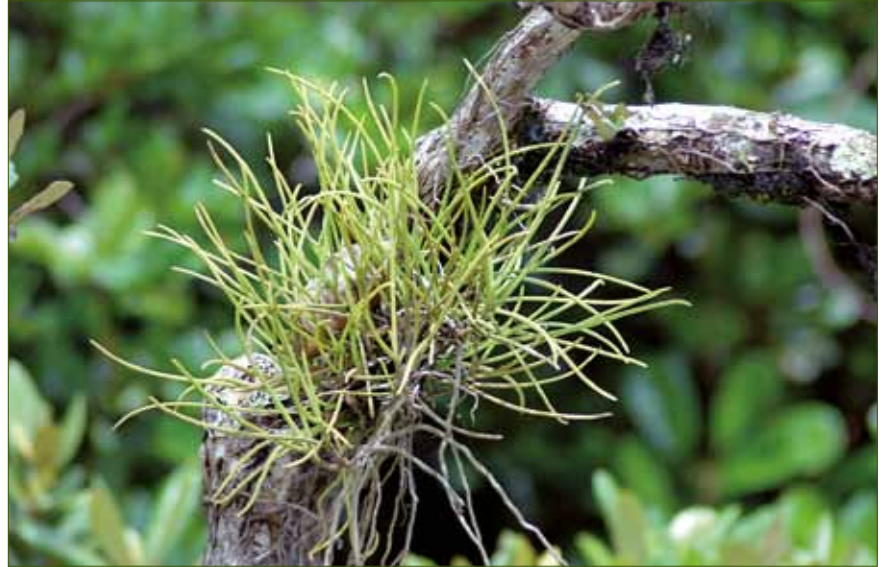
Luisia spec. , aufgenommen im Mangrovenwald der Sundarbans

Von den 193 erfassten Arten wachsen 117 epiphytisch und 69 terrestrisch (Tabelle 1). Nur sieben Arten kommen in gemischter Form vor, d. h. als terrestrische, epiphytische und lithophytische Arten. Die meisten Arten gehören vier Gattungen an: Dendrobium (30 Arten),