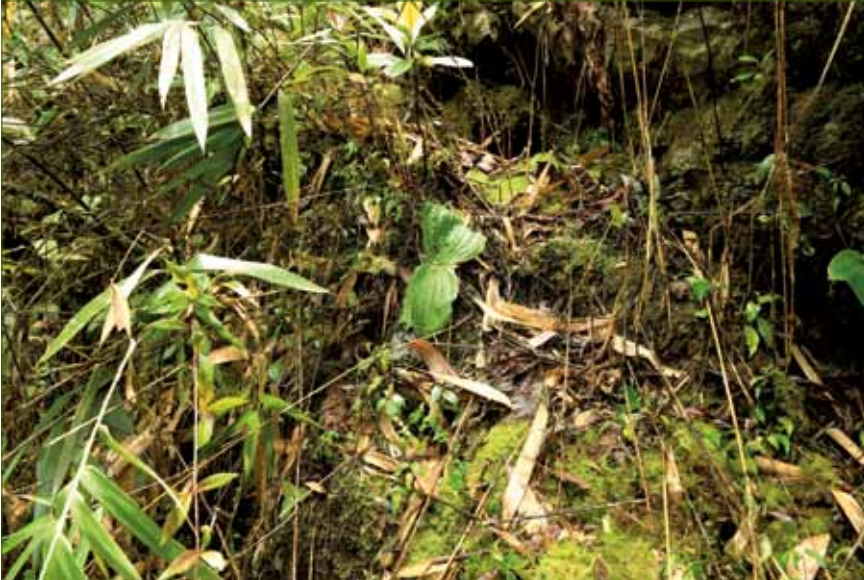
Cypripedium lentiginosum , Pflanze am Standort in Vietnam, terrestrisch wachsend ↑↓ Fotos: C. X. Canh