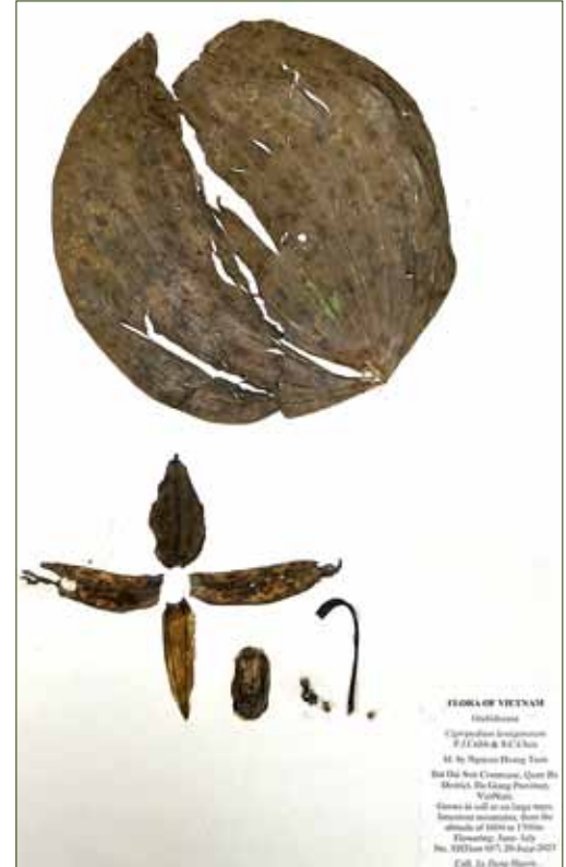
Cypripedium lentiginosum , Typusbeleg