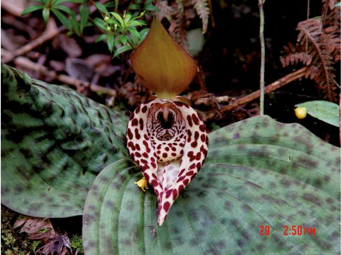
Cypripedium lentiginosum , Blüte, am Standort in China