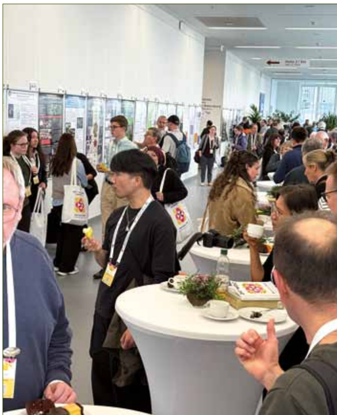
Die Poster waren im Foyer des Konferenzbereichs untergebracht und luden zu Diskussionen und zum Gedankenaustausch ein.

Der erste Schwung ist geschafft! Bis zum Mittag kommen noch weitere Teilnehmer, doch der große Andrang ist vorbei. Zeit für ein Schwätzchen und für interessante Informationen. Eine Zahl prangt auf einem der Laptops: 1005! Bis Freitag gegen 12:00 Uhr haben sich 1005 Besucher registriert und damit alle Erwartungen übertroffen!