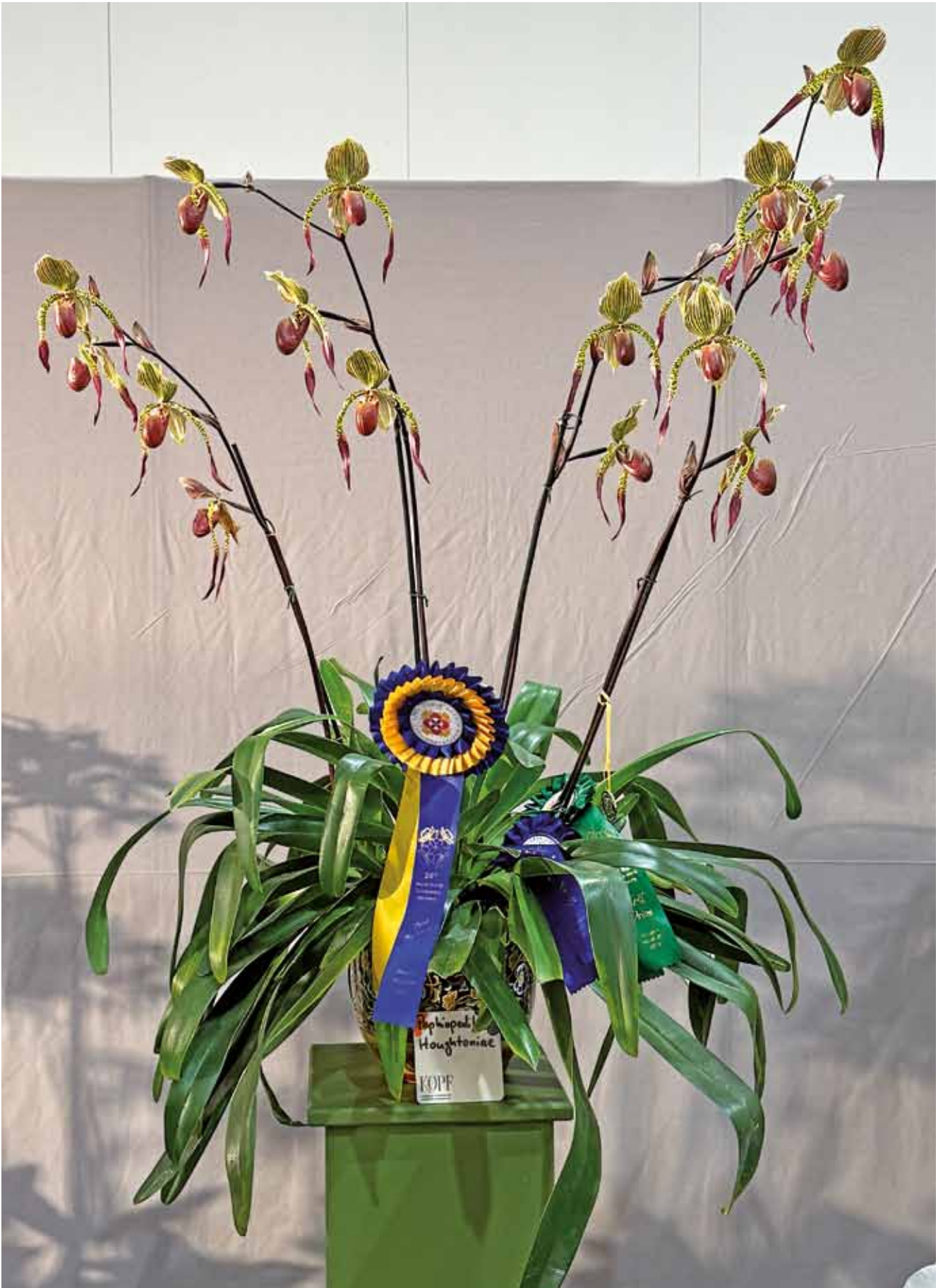
Paphiopedilum Houghtoniae 'WOC 2026' von Kopf Orchideen – Champion in der Kategorie Hybriden