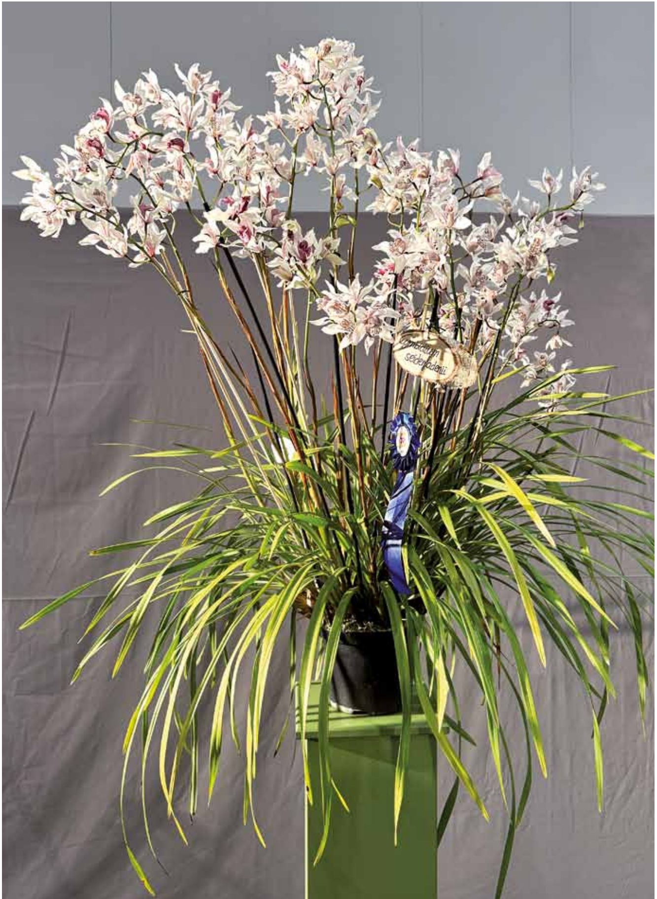
Cymbidium seidenfadenii 'Dresden 2026' von der Insel Mainau