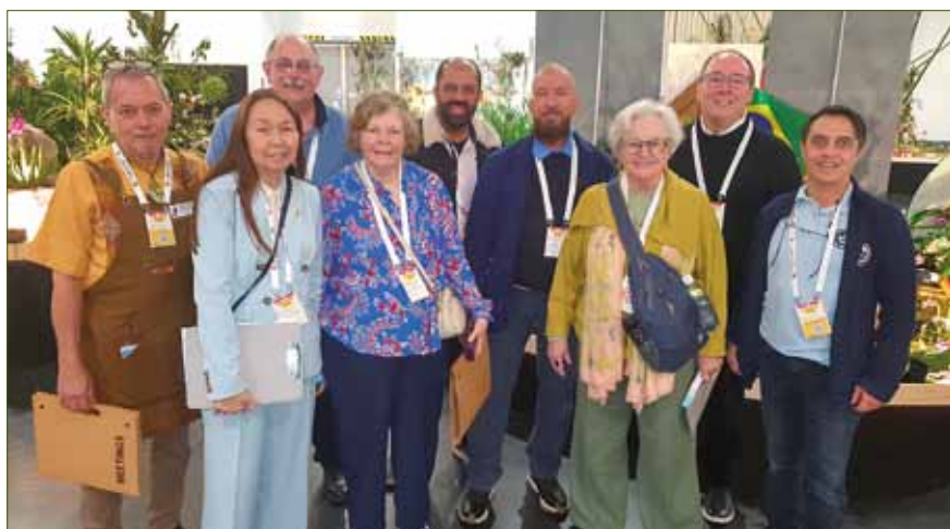
200 internationale Bewerber nahmen an der Bewertung teil – hier einige der Teams.

etwas Unerwartetes. Was genau, das sollte sich im Laufe der Woche zeigen.