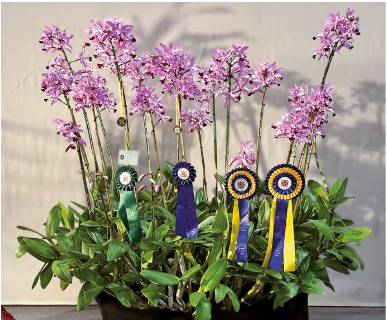
Myrmecocattleya Bordighera 'Carlo' von Associazione Italiana di Orchidologia (AIO) – Grand Champion of the Show und Champion in der Kategorie Kultur