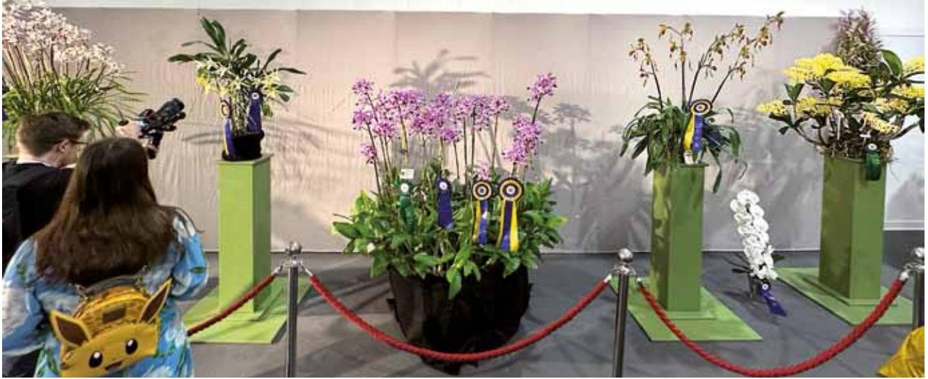
Präsentation herausragender Pflanzen – aus ihnen wurden die Champions ausgewählt.