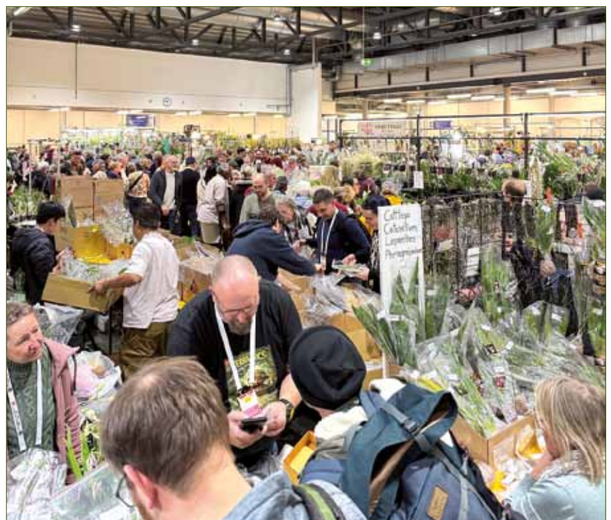
Großes Gedränge in der Verkaufshalle