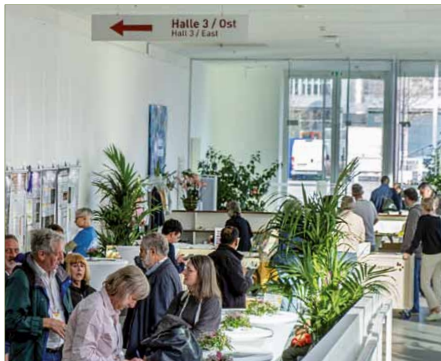
Der Registration Desk am Anfang des Konferenzbereichs war Anlaufstelle für alle Konferenzteilnehmer.

Während die Konferenzbesucher vor dem Registration Desk weniger werden, wird der Blick auf den Eingang zur eigentlichen Ostermesse frei. Auch da herrscht reges Treiben. Vorm Eingang hat sich eine beachtliche Schlange gebildet, die sich langsam ins Innere der Ausstellungshallen bewegt.