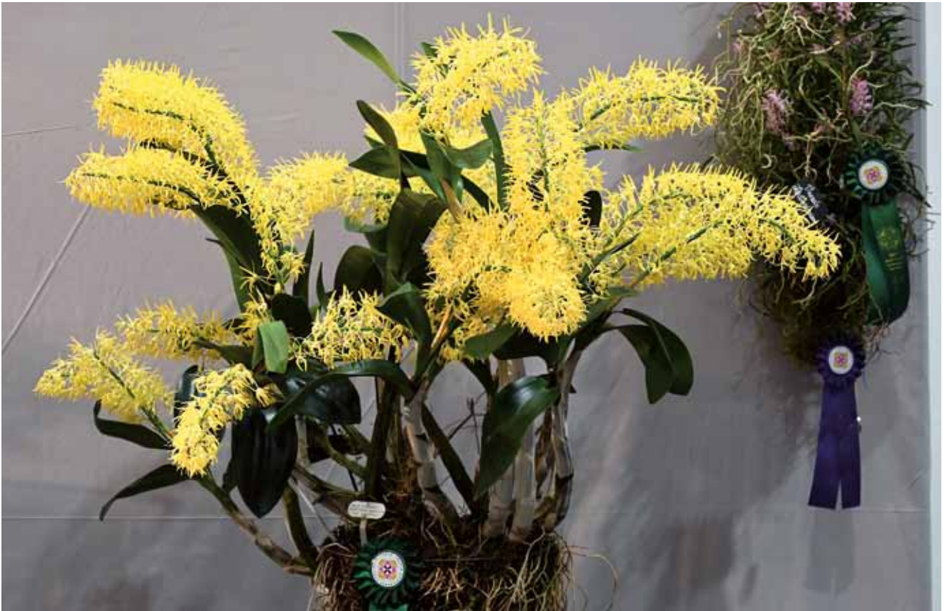
Dendrobium speciosum var. grandiflorum 'Dresden 2026' von Herrenhäuser Gärten Hannover