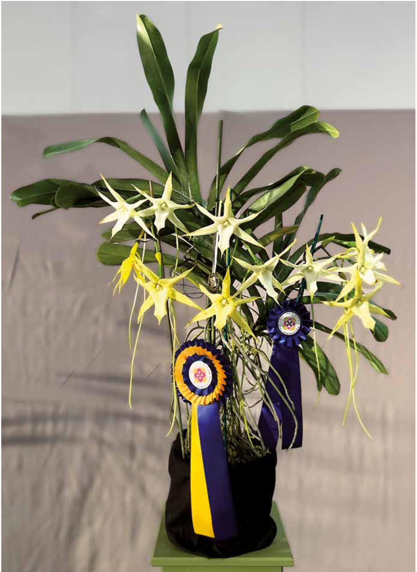
Angraecum sesquipedale 'Alessio' von AIO – Champion in der Kategorie Naturform