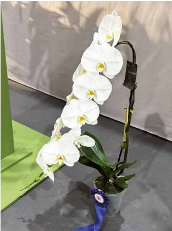
Phalaenopsis Sogo Yukidian 'V3' von Michael Tibbs