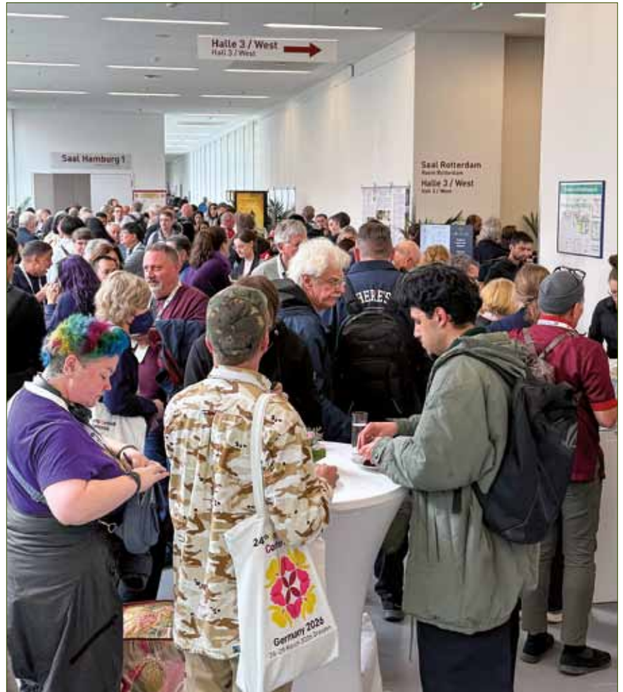
Reges Treiben im Foyer des Konferenzbereichs während der Vortragspausen

Freitagmorgen. Heute ist der Tag mit den meisten Tagesregistratorn. Und so steht wieder eine Menschentraube vor dem Registration Desk. Aber heute läuft alles routinierter ab. Nur Teilnehmer, die kurz vor der Konferenz gebucht haben, bringen das Blut der WOC-Helfer zum Wallen. Denn nun muss am Laptop nachgeschaut werden, ob der Teilnehmer registriert ist. Danach wird ein Aufkleber ausgedruckt, damit die Person ihr Eintrittskärtchen erhält. Stress! Heute starten die Vorträge um 10:00 Uhr. Jeweils drei laufen parallel. Bis dahin wollen alle, die jetzt noch vor dem Tresen stehen, in ihren Konferenzen sitzen. So muss alles flink geschehen.