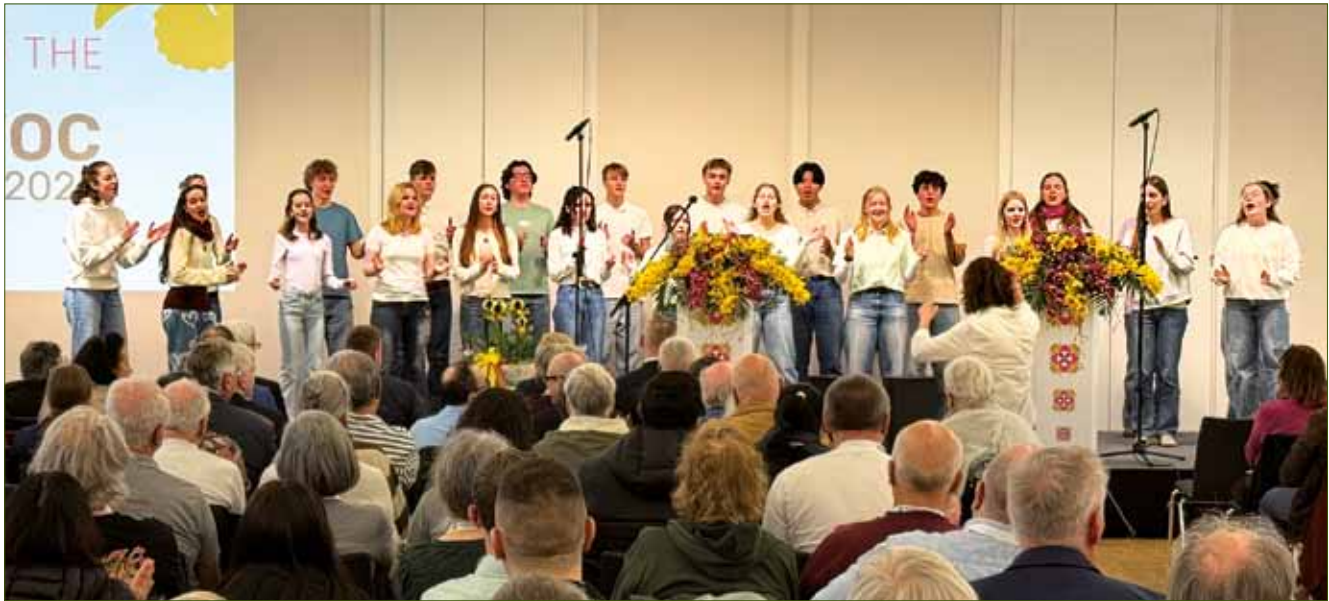
Der Jazzchor des Gymnasiums Dresden-Klotzsche sorgte mit modernen A-cappella-Stücken für Gänsehautmomente.