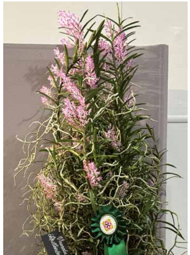
Vanda christensoniana 'Katalin' von der Ungarischen Orchideen-Gesellschaft