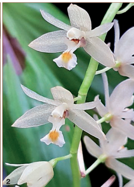
Coelogyne benkii , 1. Einzelblüte 6 × nat. Größe/single flower 6 × nat. size/fleur 6 × taille nat. 2. Teil der Infloreszenz/ inflorescence part/ inflorescence 3. Labellum, 5 ½ × nat. Größe/5 ½ × nat. size/5 ½ × taille nat.